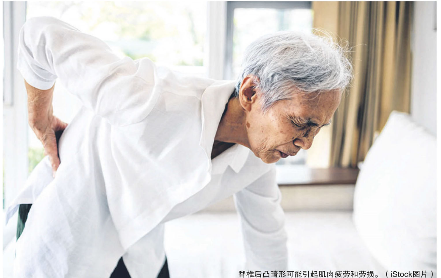
脊椎后凸畸形可能引起肌肉疲劳和劳损。