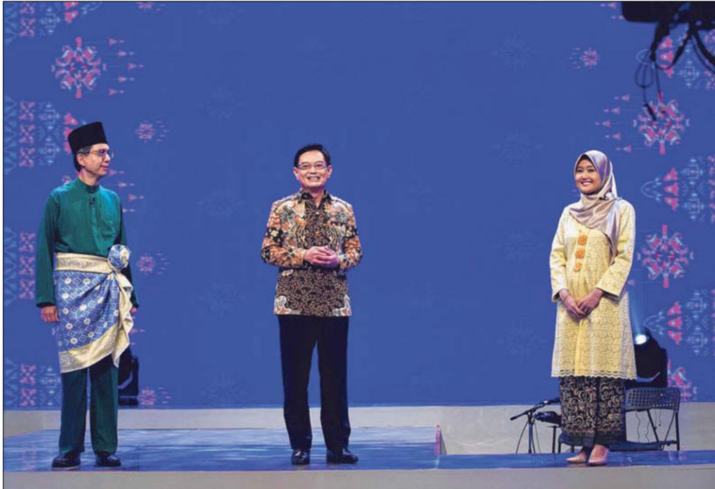
SERIKAN MAJLIS: Bulan Bahasa telah dilancarkan Sabtu lalu menerusi siaran di saluran Mediacorp Suria dengan dihadiri tetamu terhormat Timbalan Perdana Menteri, Encik Heng Swee Keat ( tengah), yang diadip Pengerusi Majlis Bahasa Melayu Singapura, Profesor Madya Dr Muhammad Faishal Ibrahim, yang juga Menteri Negara (Ehwal Dalam Negeri merangkap Pembangunan Negara) ( kiri), dan Pengerusi Jawatankuasa Bulan Bahasa, Cik Rahayu Mahzam, yang juga Setiausaha Parlimen (Kesihatan).