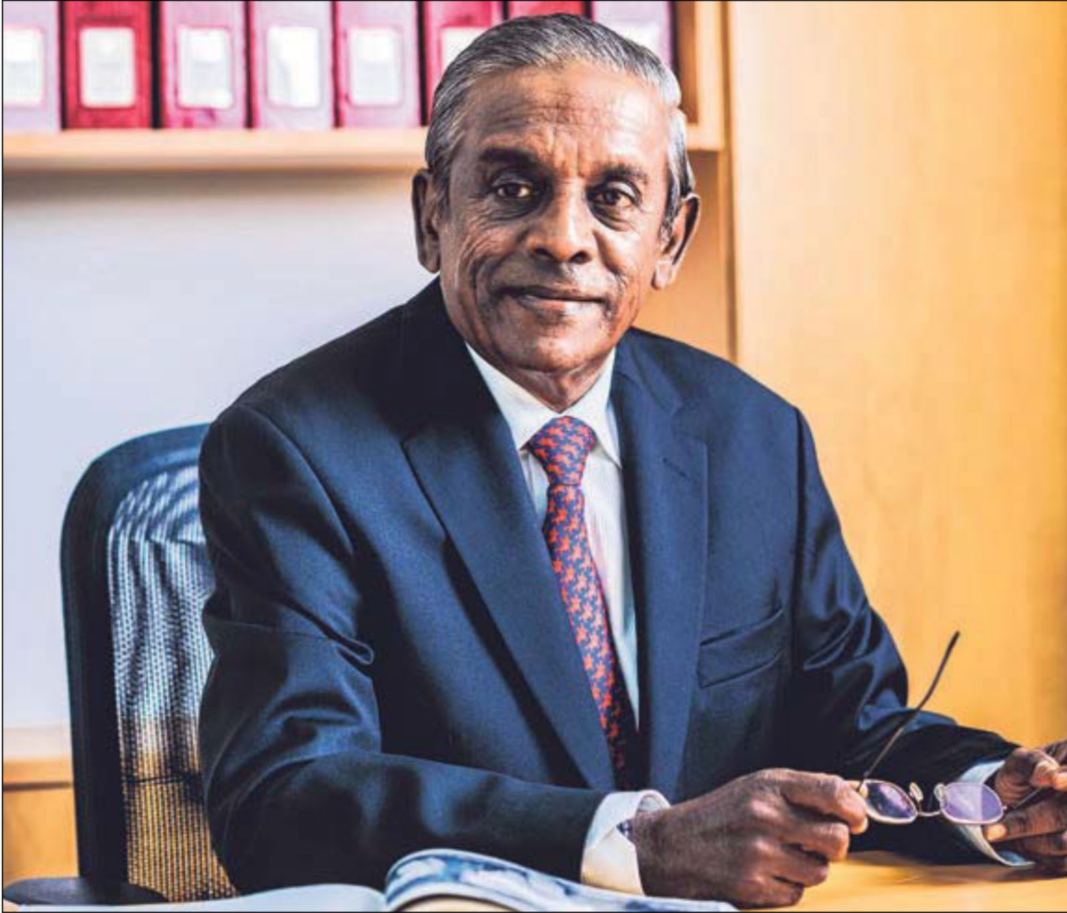
JASA DIKTIRAF: Mantan Timbalan Perdana Menteri Profesor S Jayakumar akan menerima anugerah tertinggi iaitu Darjah Utama Temasek (Dengan Kepujian Tinggi).