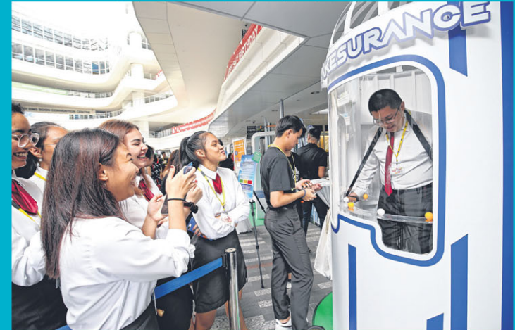
■ 三个乒乓球各代表死亡、生病和意外。“理财有方”活动参与者站在不断震动的瘦身带上，只要掉了一个球就要扣分，如果购买了“保险”，则“逃过一劫”。