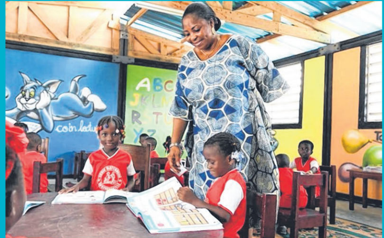
■ 这是科特迪瓦最先采用塑料砖建造的课室之一，新课室比采用传统建材的课室凉快，让学生能在更舒适的环境中学习。(互联网)