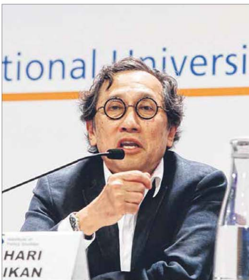
外交部前常任秘书比拉哈里昨天发表演讲，指“新加坡必须在立足于东南亚的同时，把视野放到东南亚以外”。

比拉哈里说，这意味着新加坡不能将它能在国际和区域发挥的作用视为理所当然。“新加坡必须在立足于东南亚的同时，把视野放到东南亚以外。”