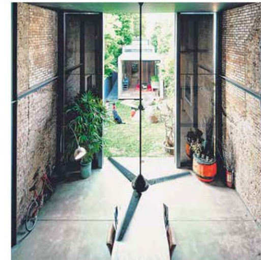
建筑师在“幸运书店”屋后建了五个由水泥混凝土立方体组成的别院。