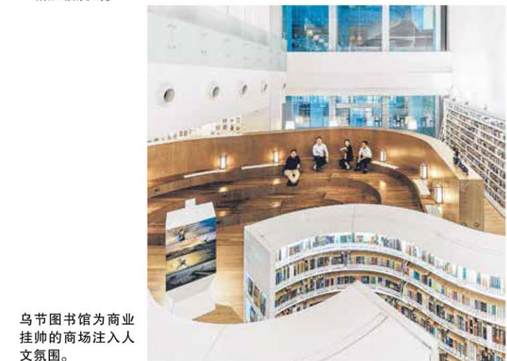
乌节图书馆为商业挂帅的商场注入人文氛围。

●“没有多余的空间了吗？”展览将在威尼斯建筑双年展落幕，2019年回到新加坡展出。