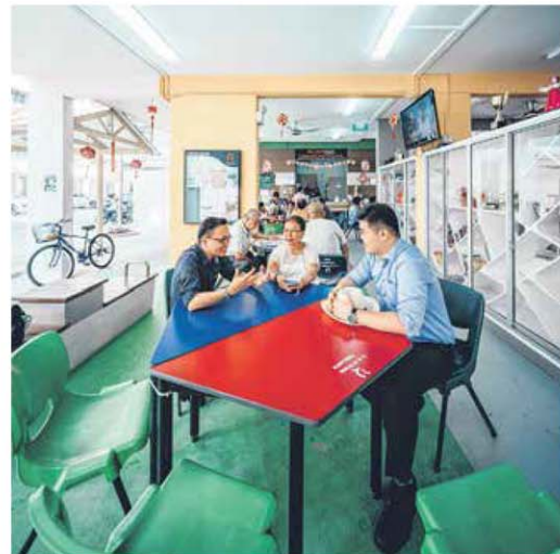
淡滨尼组屋底层变为居民的社区客厅。