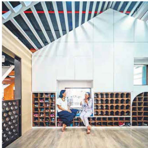
设计“The Caterpillar's Cove”幼儿发展与学习中心的王可欣（左）与业主对谈。