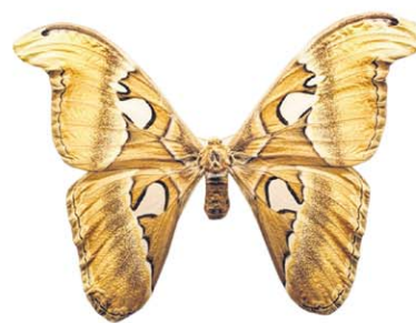
义顺一带近年来两次出现大量皇蛾幼虫。

其实这种蜥蜴身侧长有翼膜（其肋骨的延伸），展开时能让它滑翔，在林间如飞虫一样穿梭。