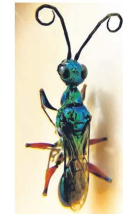
扁头泥蜂虽是昆虫界有名的蟑螂杀手，却因为繁殖能力较低而“寡不敌众”。

斑飞蜥身体长度一般约为85毫米，捕食昆虫为生，普遍分布于新加坡本岛与外岛，甚至在路边树丛间都能发现它们的踪迹，但由于身形小，颜色又接近枯叶，因此它们虽然很普遍，但很少被人发现。