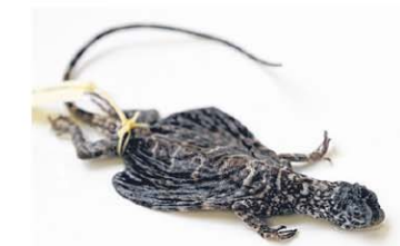
斑飞蜥身侧长有翼膜，展开时能如飞虫一样在林间滑翔。