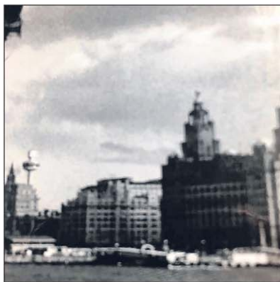
BANDAR LIVERPOOL: Suatu ketika ia merupakan bandar pelabuhan yang mampan.