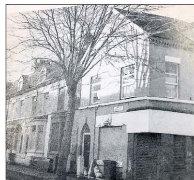
TEMPAT BERJUMPA: Kelab Melayu di 7, Jermyn Street di Liverpool yang menjadi tempat pertemuan bekas pelaut Melayu.

"Semasa saya memulakan kajian pada 2003, seorang bekas pelaut termuda yang saya temui berusia lewat 60-an. Jadi, sukar mereka meneruskan kelab Melayu di Liverpool itu, justeru, sebabnya bukan hanya kerana jumlah anggota yang semakin kecil."