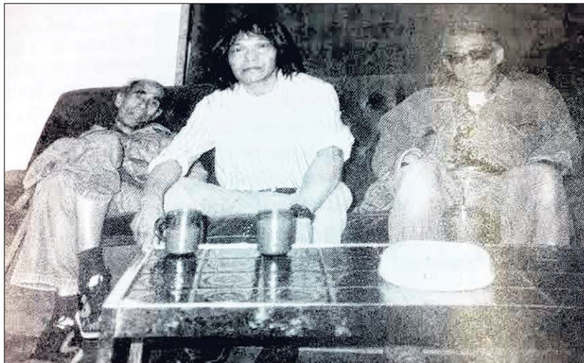
PERANTAU LAUT: Tiga bekas pelaut Melayu yang tidak dinamakan di Kelab Melayu di Liverpool, England, yang dipaparkan dalam buku Profesor Tim Bunnell.