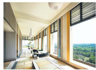
杜生庄四处设有开放公共空间，减少密集高楼居住的压迫感。

照片提供： 印度文化馆：Robert Greg Shand建筑事务所 杜生庄：WOHA建筑事务所 杜生阁：SCDA建筑事务所 公务员俱乐部：DP建筑事务所 WOWHaus会所：WOW建筑事务所 SUTD：UNStudio与DP建筑事务所 南大新学习中心：CPG Consultants