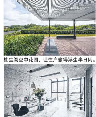
WOWHaus会所新增楼的落地玻璃窗，让住户在视线内紧靠保留区。