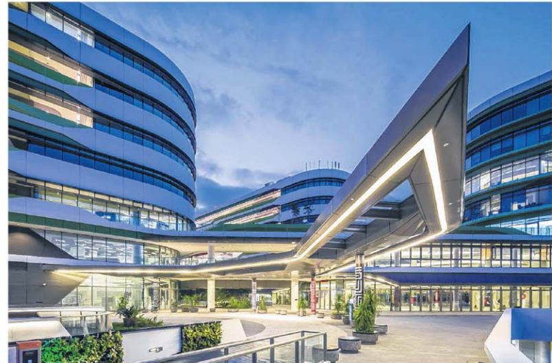
非直线地面走道将SUTD校舍与宿舍连成一线。