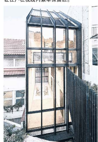
尼文路老店屋背后新建窄长玻璃屋，内部空间新旧一气呵成。