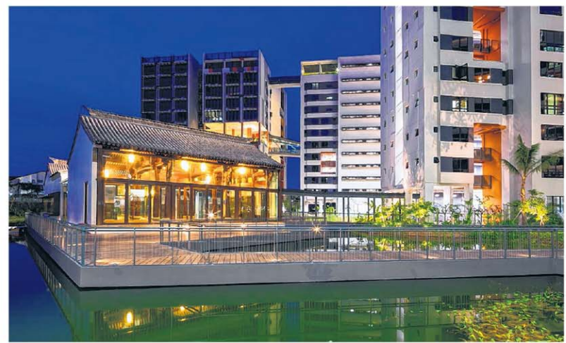
影星成龙捐赠给SUTD的两座徽州古建筑与现代校舍相映成趣。

欲知建筑游和建筑节更多详情，请上网： archifest.sg/2015/ 。建筑游每个行程成人收费50元，学生42元。