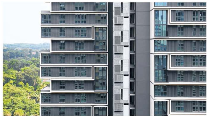
杜生阁的格局与设计对我国关注的多代同堂居住课题提供了创意解答。

来到保留旧店屋，许多发展商往往只保留了它的外在，却无法留住它们当年的社区精神，住在里头的都是一个富裕而封闭的个体。宋侯川认为，Ong & Ong建筑事务所设计的如切区The Cranes，就把三栋连接的老店屋发展成一间间独立而隐秘的公寓，“但里头和屋后却有相连的公共空间，串联各户屋主，让人联想到上一代人守望相助的生活方式。”