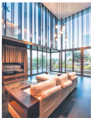
公务员俱乐部新建面海别墅，大大升级俱乐部格调。

建筑游共分成八个行程，每个行程深入体验三个建筑，绝不重复，而每栋建筑都由操刀设计的建筑师亲自讲解。