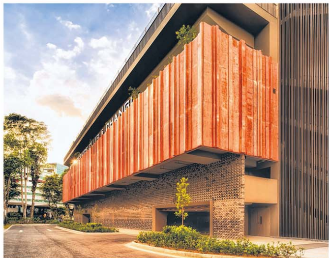
公务员俱乐部新建活动中心，波浪形石砖墙造型呼应樟宜海滩。