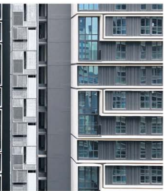
杜生阁空中花园，让住户偷得浮生半日闲。

照片提供： 印度文化馆：Robert Greg Shand建筑事务所 杜生庄：WOHA建筑事务所 杜生阁：SCDA建筑事务所 公务员俱乐部：DP建筑事务所 WOWHaus会所：WOW建筑事务所 SUTD：UNStudio与DP建筑事务所 南大新学习中心：CPG Consultants