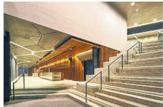
印度文化馆门前宽阶梯与小印度街道接地气。

建筑师珊特透露，这叫人怦然心动的玻璃窗，灵感来自古印度建筑里的阶梯井（Baoli stepwell），是古印度文明的一个标志，提供蓄水功能，方便民众汲水之余，也提供纳凉等多功能。