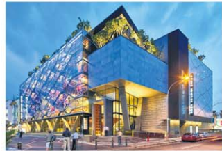
印度文化馆夜放光明。

他说：“中心入口的宽阶梯把公众从小印度大街引入二楼参观文物展览，有接地气的功能。原地三角形的地皮是设计这座中心最大的挑战，所以我们必须善用有限的空间，一个空间得有不同用途。我很高兴我们做到了。”