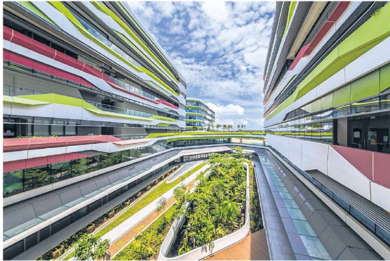
SUTD校舍与宿舍连成一体，将学习融入住校生活。