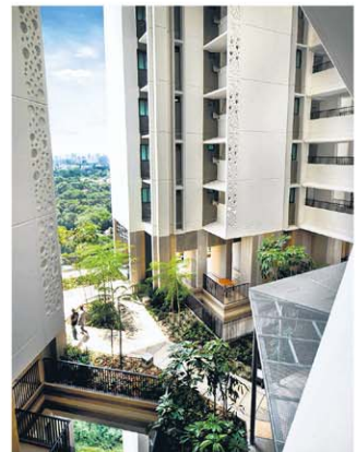
杜生庄为热带气候设计，强调自然通风、防夕照。