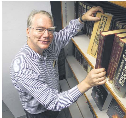
丁荷生教授说，当人们不再把祖先供奉在家里，而是把祖先牌位交由庙宇管理，中元节与清明节就显得重要，能为人们提供心理慰藉。