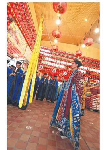
去年中元，韭菜芭城隍庙由道士长领导诵经团及道乐团启建“铁罐施食”道场，以赈济孤魂，福被众生。