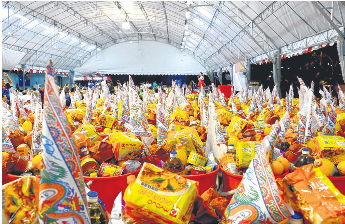
←本地中元节从地点、排场到表演形式都具备地方特色。中元节与歌台、戏台融合，同时娱乐人、神与鬼。

七月普度是华人较大的文化遗产。丁教授笑说：“比起西方万圣节一年只用一天处理鬼，一个月处理的中国的鬼比较厉害。对中国人来说，祖先祭拜仪式很重要，显示人死后还在人间，否则为何天天给它吃饭？人间与祖先一体是比较特殊的文化现象，给予生者生活的动力。”