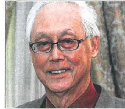
ENCIK GOH CHOK TONG: Berucap pada Sidang SG50+ anjuran Institut Pengajian Dasar (IPS) dan Sekolah Dasar Awam Lee Kuan Yew, Universiti Nasional Singapura (NUS).

“Teknologi seperti ini meratakan gelanggang permainan dan mendemokratisasikan maklumat di tangan rakyat. Mereka memainkan peranan