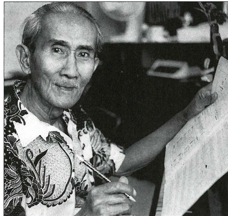
ALLAHYARHAM ZUBIR SAID: Lagu kebangsaan yang beliau cipta pada 1958 dianggap peristiwa paling penting dalam sejarah Singapura oleh responden Melayu yang ditinjau.

"Saya fikir kaum minoriti, secara umumnya, mereka lebih sedar tentang konteks berlakunya insiden-insiden bersejarah. Mereka lebih banyak menumpukan perhatiannya kepada ehwal semasa yang dikaitkan dengan berlakunya peristiwa-peristiwa itu."