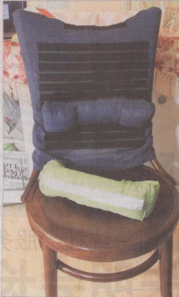
由南洋女中学生设计的这个靠垫，其支撑圆枕可轻易调整位置，而且还有不同颜色的布料供选择。

本地公共交通工具一般“不欢迎”公众携带榴梿上车，让榴梿爱好者实为苦恼，而为解决这个问题，欧南中学学生花了一个月研发独特的密封塑料袋，可完全隔绝食物味道。